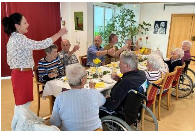
...die monatlichen Geburtstagsfeiern sind besondere Highlights...