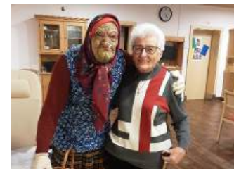
...die Budlmuada war bei uns...