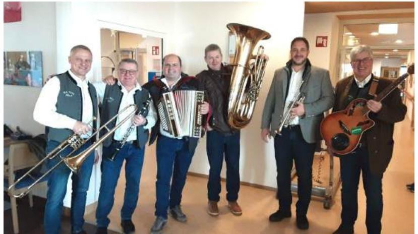
Neujahrsgeigen: Ein herzliches Danke an die „Nix Neix Musi“ .