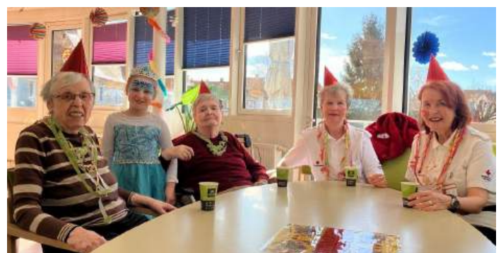
...der ehrenamtliche Besuchs- und Begleitdienst der Rettung ist mittendrin...