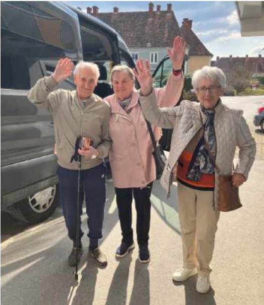
...ein Ausflug mit unserem Bus zum Lieb Markt ...