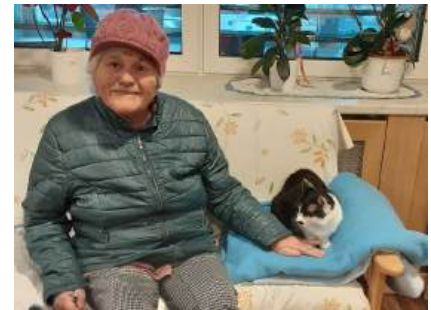
...nicht für die Katz ist unser Zorro...